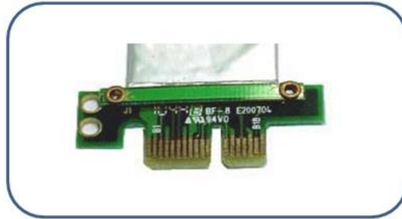
PCI Express 1x