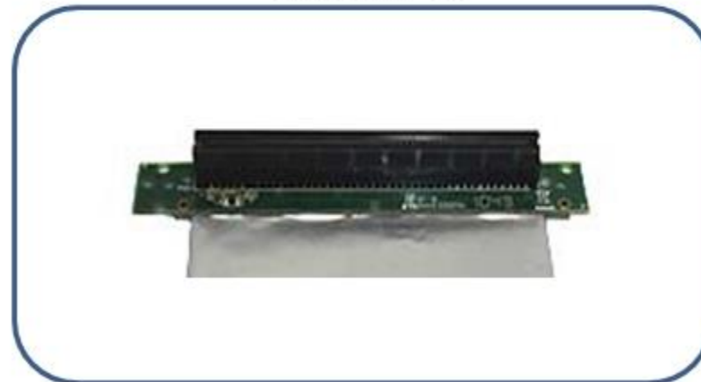
PCI Express 16x